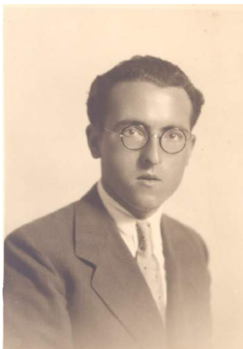
Vicent Garcés Queralt en su juventud.

Y todavía encontramos un tercer periodo compositivo marcado por su estancia en París. En 1948 recibe otra beca para estudiar en París durante tres meses, pero prolongaría su estancia en la capital francesa durante cinco años (1948-1953), donde recibiría la influencia del "Grupo de los Seis", especialmente de Georges Auric, quien además le revisaría su ballet Marinada . Volverá a Valencia en 1953. En general, la última etapa compositiva de Vicent Garcés Queralt está caracterizada por el silencio creativo y la autocrítica, aunque se interpreten algunas de sus obras más destacadas en los años 70 y 80. Se casó con Amparo López Blasco en 1973, y murió en Valencia el 20 de febrero de 1984. Sus restos mortales fueron trasladados al cementerio de Faura en 1997.