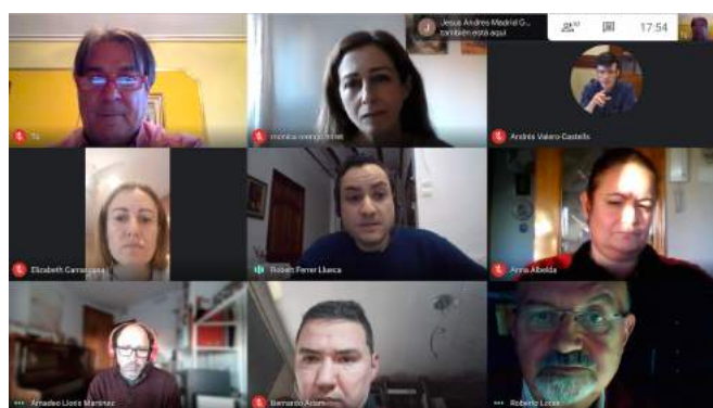
Reuniones Junta de Gobierno (2 y 16 de febrero de 2021)

Y a la espera de poder ir concretando todos nuestros propósitos, algo más ambiciosos que en años anteriores por la liberación de la incoherente dependencia de las fortuitas y ocasionales subvenciones oficiales a las que hemos tenido que acogernos hasta la fecha, vamos viendo poco a poco la luz en cada nueva reunión telemática de la Junta de Gobierno.