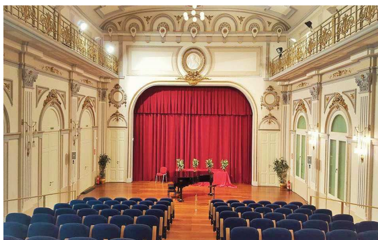
Fig. 3. Salón de actos del conservatorio de Valencia, plaza San Esteban.

La música, como actividad artística y también pedagógica, se estableció en la sociedad valenciana en muy diferentes formas. En esta época, hubo un hecho determinante: la progresiva secularización de la enseñanza musical. De este modo, vemos cómo desde mediados del siglo XIX, van apareciendo diversas entidades valencianas 20 que, al igual que las instituciones religiosas, quedarán vinculadas a la pedagogía musical y a la difusión de la cultura musical. Serán, principalmente: la Sociedad Económica de Amigos del País (SEAP) (1776), el Liceo Valenciano (1841) y la Sociedad Instituto Musical (1868), que