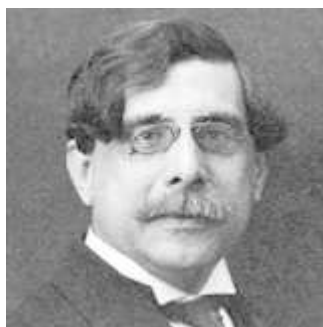
Fig. 1. Eduardo López-Chavarri Marco