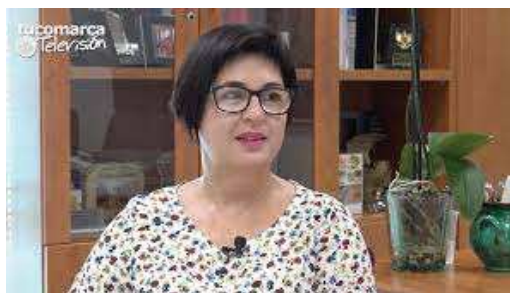
Juncal Carrascosa (Alcaldesa de Buñol)

Y finalmente al Ayuntamiento de Buñol, por todo su apoyo a la música en general durante largos años, lo cual ha permitido situar a la ciudad a la cabeza en cuanto a importancia musical se refiere, tanto a nivel de la Comunidad Valenciana en particular como de España en general, abanderada por sus dos magníficas Bandas de Música con sus escuelas de música y teatros y su Conservatorio Profesional de Música.