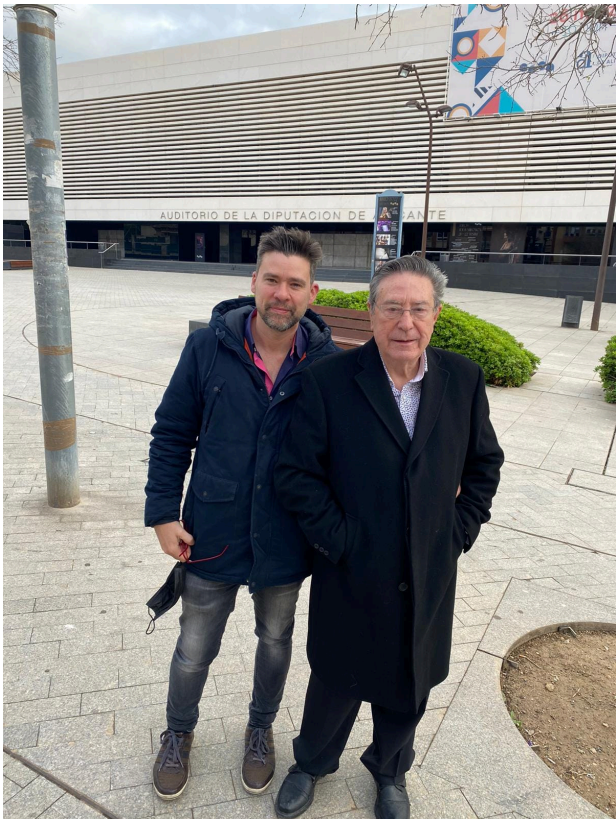
Padre e hijo antes del estreno