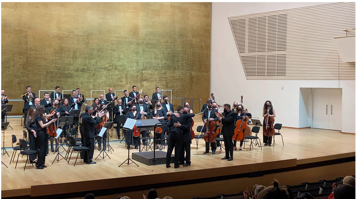
Padre e hijo fundidos en un abrazo tras el estreno