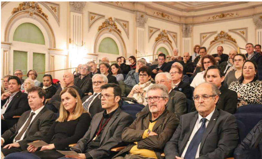
Acto de Insignes 21-11-2023

Mención especial merece en este mes de la música, noviembre, el acto de entrega de las distinciones “Insignes 2023”, que todavía tenemos todos presente en nuestro día a día. Un acto que este año ha tenido una gran relevancia que se hizo notar en la cantidad de público que se dio cita en el mítico Salón de Actos del Conservatorio de San Esteban. Hubo música, hubo discursos de agradecimiento, hubo reencuentros, hubo empatía y mucha humanidad en torno a unas personas y a un hecho: La Música Valenciana.