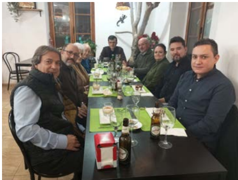
Junta de Gobierno. Cena de Navidad

Que, a pesar de todos los pesares, este año sea para todos/as un buen año.