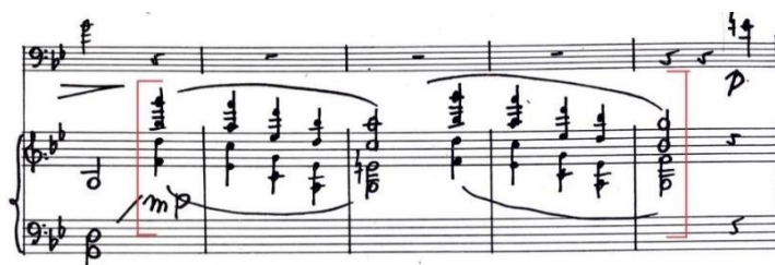
Figura 8. Interludios. Adagietto (cc. 20-24).