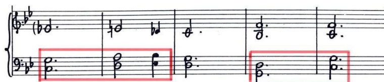
Figura 2. Quintas paralelas en la mano izquierda. Adagietto (cc. 5-9).

Por otro lado, se trata de una armonía tratada de forma libre en cuanto al número de voces y la funcionalidad de los acordes, por lo que no se procederá a hacer un análisis de cada acorde de la manera tradicional. Prueba de ello son, por ejemplo, las quintas paralelas de la mano izquierda del piano, las cuales resultan de la verticalización del motivo principal que insiste en el intervalo de quinta justa ascendente como idea principal.