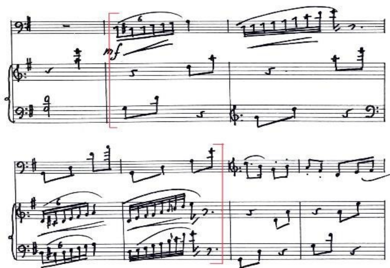
Figura 19. Inversión. Allegro ma non troppo (cc. 37-43).

mayor virtuosismo que contrasta con el motivo principal. Este aparece tanto en el chelo como en el piano, realizando inversiones a lo largo del movimiento.