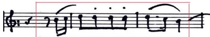
Figura 14. Motivo A. Allegro ma non troppo (cc. 4-6).

base de segundas y repeticiones. De hecho, melódicamente es un palíndromo 4 melódico. Este motivo principal es un tricordo formado por las notas si, do y re. Es curioso el hecho de que el patrón de acompañamiento del piano presenta al inicio un bajo en sol, que durante la obra paso por la y finalmente por si, pudiendo ser esta la justificación a las diferentes modulaciones que se producen durante el movimiento. De este modo, se consigue proyectar en el bajo la idea melódica del tricordo del motivo principal, pero empezando esta vez por sol.