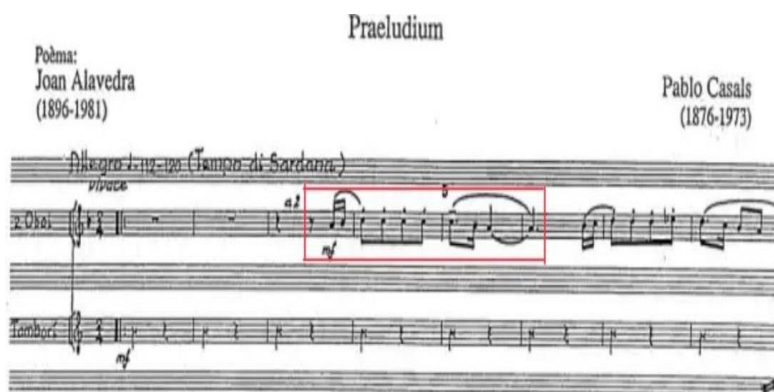
Figura 13. Motivo inicial de la obertura de El Pessebre de Pau Casals (cc. 1-8).

Tomando de nuevo como referencia el comentario escrito por Rodrigo en el manuscrito de la obra, se puede conocer que, el tema inicial que expone este movimiento, se corresponde con el interpretado por el oboe en la obertura de la obra El Pessebre de Pau Casals.