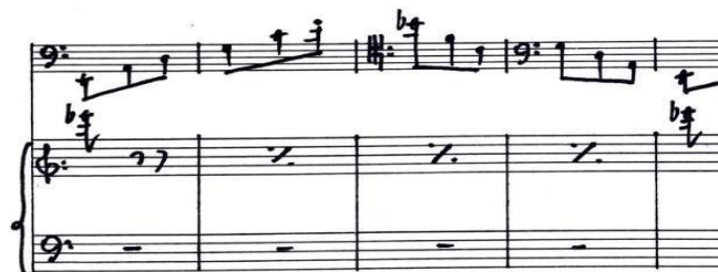
Figura 4. Moto perpetuo (chelo) y ostinato (piano). Scherzino (cc. 73-77).

Allegro ma non troppo