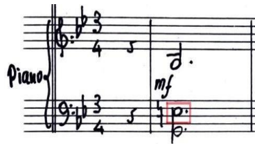
Figura 3. Sol dórico (mi natural). Adagietto (c. 1).

del chelo en el c. 10, el cual está vinculado a la escala melódica. No obstante, este mismo mi actúa como una nota de color, evocando al modo sol dórico cuando aparece en el c. 1 en el piano, lo cual puede deducirse por el contexto en el que se encuentra. Por otro lado, en el c. 11 el piano ejecuta un sol mientras que el chelo interpreta un fa sostenido, prueba del papel prominente que juegan las disonancias a lo largo de todo el movimiento.