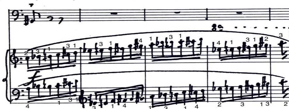
Figura 21. Digitación sugerida. Scherzino (cc. 163-167).

La siguiente imagen proporciona una sugerencia de digitación para las escalas ascendentes cromáticas en el piano, la cual trata de realizar el menor número de cambios posibles, teniendo al mismo tiempo un punto de apoyo notable sobre los pulgares al comienzo de la segunda escala, es decir, al inicio de la segunda mitad del pasaje.