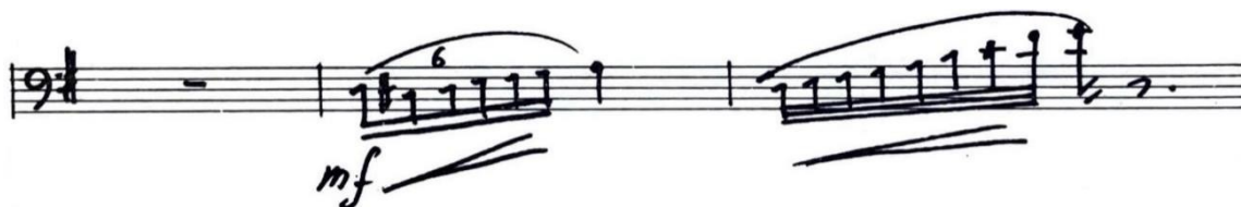
Figura 16. Motivo B. Allegro ma non troppo (cc. 37-39).

Además, en los seisillos de los episodios se encuentra la presencia de un motivo b más virtuosístico, el cual podría derivar de las escalas cromáticas del Scherzino . No obstante, este motivo es diatónico y se asemeja a un arabesco 5 .