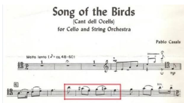
Figura 5. Motivo del Cant dels ocells (cc. 1-10). Figura 6. Motivo inspirado en el Cant dels ocells .

En el manuscrito de la obra, el cual se encuentra en Homenaje a Pablo Casals (1977) , el mismo Rodrigo hace un pequeño comentario apuntando que en este primer movimiento se despliega una grave melodía en la que se incluyen ciertas referencias a El cant dels ocells , una canción popular catalana por la que Pau Casals sentía una profunda admiración. Esto puede apreciarse claramente en algunos motivos del chelo, los cuales son melódicamente idénticos a ciertos pasajes de la melodía mencionada con anterioridad.