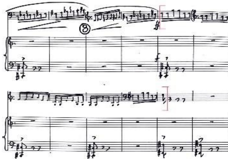
Figura 18. Scherzino (cc. 127-138).

A continuación, cuando parece que todo el movimiento va a desarrollarse en la misma línea, se produce un gran cambio donde el piano vuelve a tener un ostinato, esta vez en octava en registro grave y fuerte, mientras que el chelo cambia a semicorcheas realizando una escala cromática fuerte y legato . Hasta este momento, la única unidad rítmica había sido la corchea. Más adelante, en el c. 131 se produce un cambio en el chelo recordando las cuartas, pero en semicorcheas.