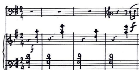
Figura 1. Decorado. Allegro ma non troppo (cc. 1-4).

Los compases que sirven de introducción a la melodía son denominados por los franceses como decorado, los cuales presentan el patrón de acompañamiento antes de que suene el motivo principal en el chelo en cada uno de los estribillos.