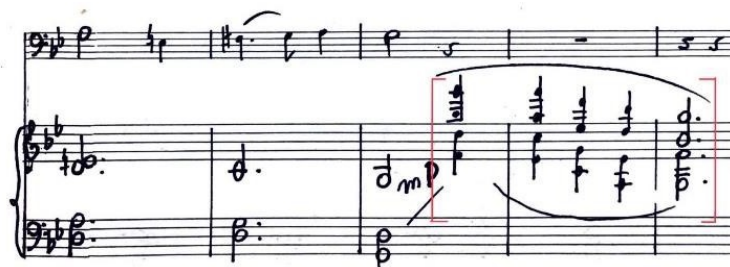
Figura 7. Interludios. Adagietto (cc. 10-14).

la textura de este movimiento es de melodía acompañada.